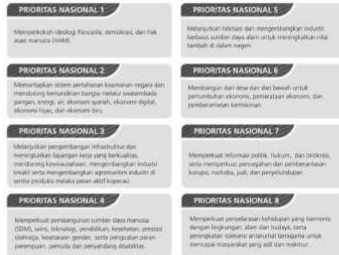
Gambar 3 Prioritas Nasional 2025

Keterkaitan RKP Tahun 2025 dengan pencapaian RPJPN 2025-2045 adalah bahwa RKP Tahun 2025 berkedudukan sangat strategis karena memuat fondasi awal untuk dapat menghubungkan transisi estafet pembangunan menuju Indonesia Emas 2045. Peta jalan menuju Indonesia Emas 2045 mengusung paradigma transformasi secara menyeluruh di berbagai bidang, berlandaskan kolaborasi dari seluruh elemen bangsa. Langkah konkret operasionalisasi agenda transformasi mengawal Indonesia Emas 2045 diwujudkan melalui delapan prioritas nasional.