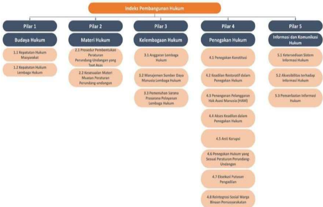
Gambar 6 Indeks Pembangunan Hukum

Pengukuran IPH terutama pilar 3 (tiga) Kelembagaan Hukum, pilar 4 (empat) Penegakan Hukum, dan pilar 5 (lima) Informasi dan Komunikasi Hukum menyertakan sumber data dari lembaga yang memiliki fungsi penuntutan. Seperti pada pilar 3 Kelembagaan Hukum dengan turunan Variabel 3.1. Anggaran Institusi Penegakan Hukum yang dilengkapi dengan Indikator yaitu 3.1.1. Tingkat Kecukupan Anggaran Penanganan Perkara, maka sumber data administratif salah satunya berasal dari Kejaksaan yang meliputi atas 3 (tiga) data, yaitu: 1)