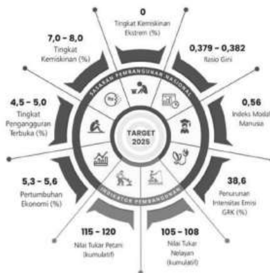
Gambar 2 Sasaran Pembangunan Nasional 2025

RKP Tahun 2025 merupakan perencanaan tahunan di masa transisi yang menjadi tahap awal pelaksanaan berbagai agenda pembangunan untuk mewujudkan Indonesia Emas 2045. RKP Tahun 2025 merumuskan sasaran pembangunan nasional tahun 2025 diarahkan untuk meningkatkan pertumbuhan ekonomi, indeks modal manusia, nilai tukar petani, nilai tukar nelayan, dan menurunkan tingkat pengangguran terbuka, rasio gini, tingkat kemiskinan, tingkat kemiskinan ekstrem, serta intensitas emisi gas rumah kaca.