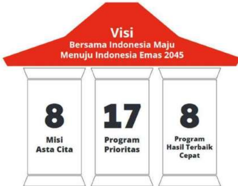
Gambar 1 Bersama Indonesia Maju Menuju Indonesia Emas 2045

Rancangan Awal RPJMN 2025-2029 yang juga merupakan turunan dari RPJPN 2025-2045 ditujukan untuk mewujudkan Indonesia setara negara maju di tahun 2045 dan mencapai cita-cita Indonesia Emas 2045. Rancangan Awal RPJMN 2025-2029 juga mengikuti 8 (delapan) misi atau asta cita yang didukung oleh 17 Program Prioritas dan 8 (delapan) Program Hasil Terbaik Cepat ( Quick Wins ). Disamping sebagai pelaksanaan tahap awal dari RPJPN Tahun 2025-2045, RPJMN Tahun 2025-2029 juga merupakan penjabaran visi dan misi dari Presiden Prabowo Subianto dan Wakil Presiden Gibran Rakabuming Raka.